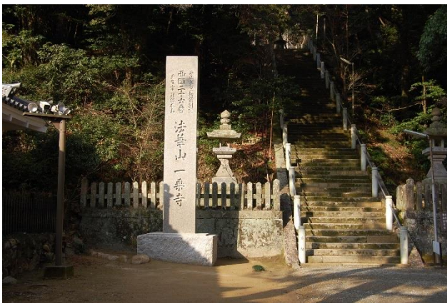
□ 一乗寺標柱 兵庫県加西市 犬島石で高さ5m 総重量20t