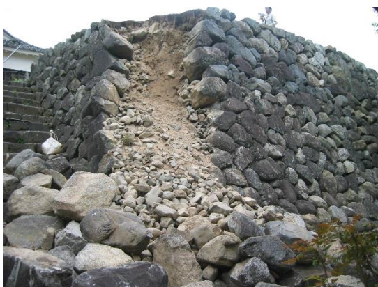
亀山城石垣解体修理