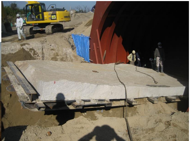
□ 岡山市犬島 自然石の外壁と割石による内壁+巨石の敷石