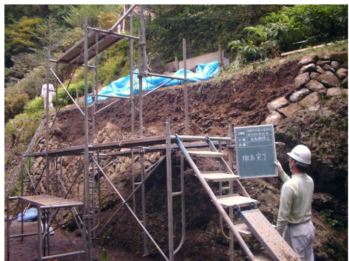
十津川村玉置神社石垣修理