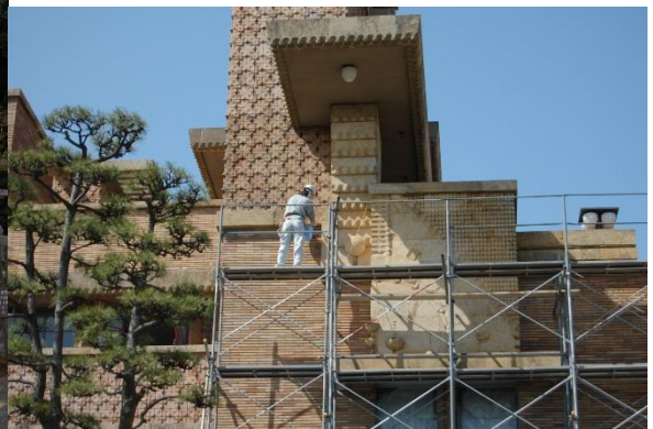
□ 武庫川女子大学 甲子園会館 西宮市 建造物の石材強化