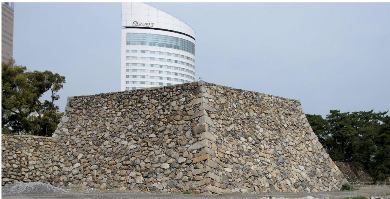
上：高松城天守台23年度完成