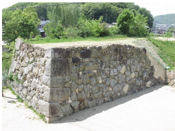
左中：姫路城清水門石垣修理