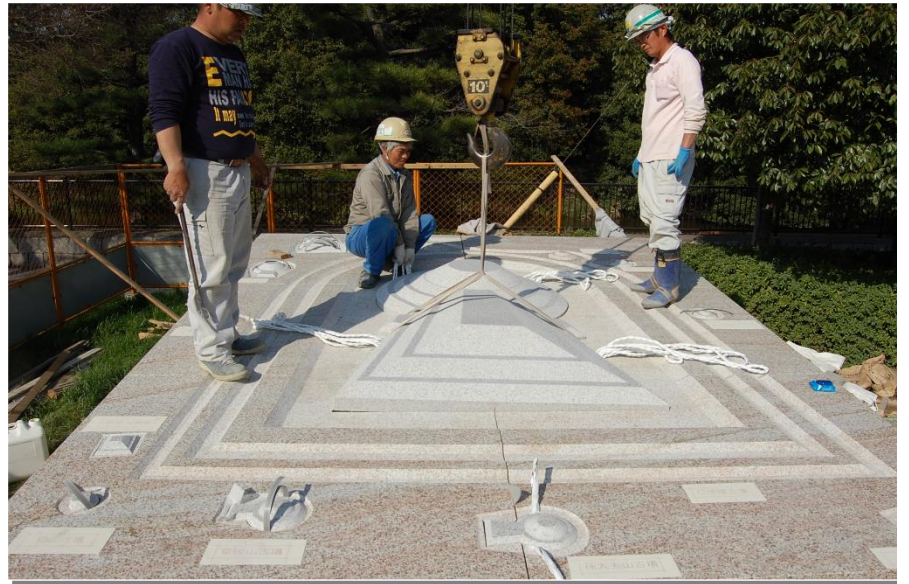
仁徳天皇陵屋外模型