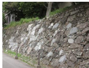
中下：金峯山寺（奈良県吉野町）