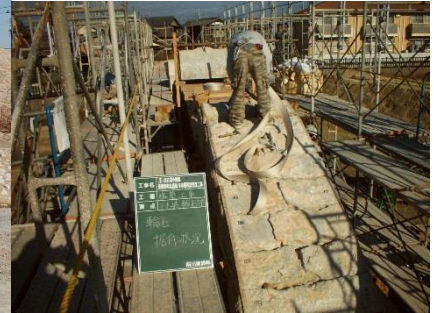
□ 赤穂石での滝組 平木橋解体復元（大正4年築）兵庫県加古川市 石造+煉瓦のアーチ橋