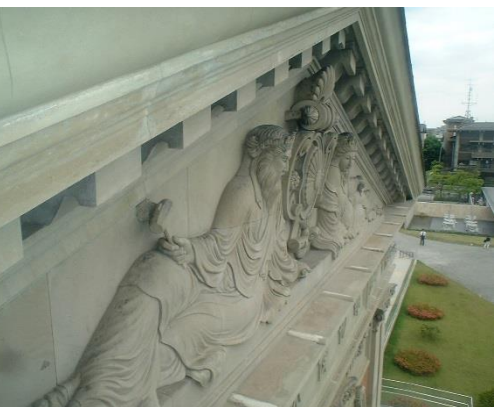
京都国立博物館石材強化