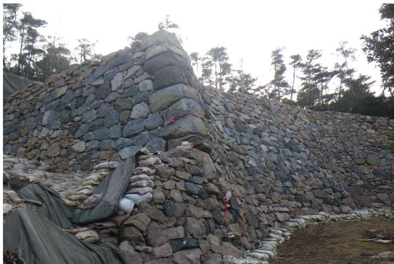
左上：屋島城（高松市 古代山城）